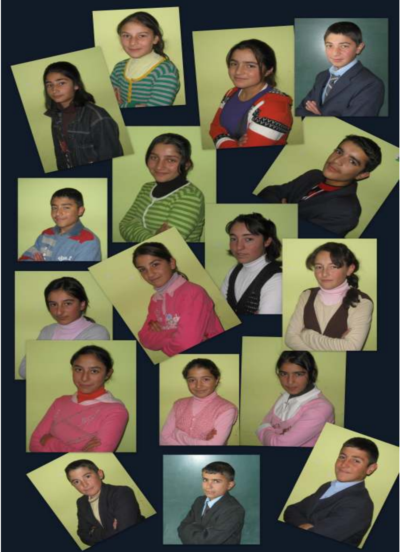
Edebiyat Egzersiz Topluluğu